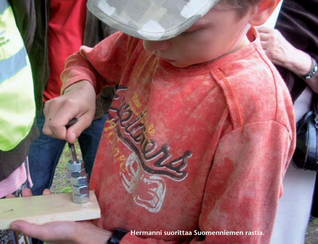
Hermannin suorittaa Suomenniemen rastia.