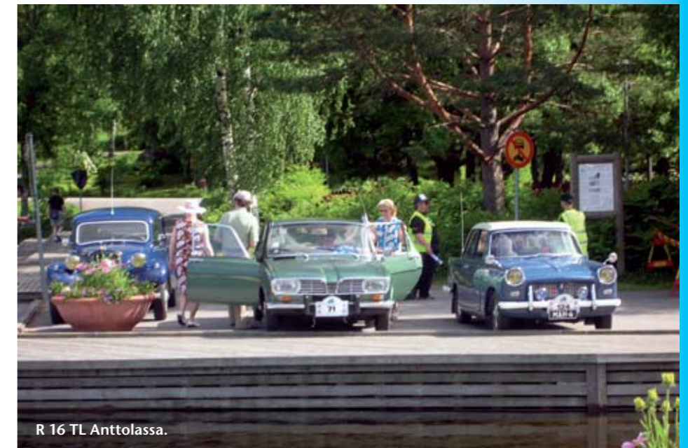
R 16 TL Anttolassa.