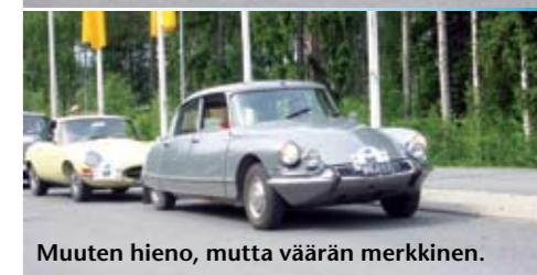
Muuten hieno, mutta väärän merkkinen.