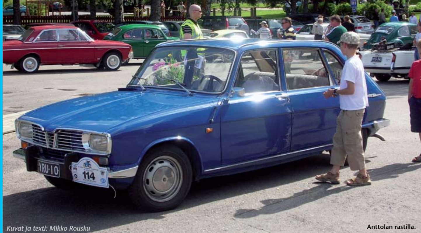
Kuvat ja teksti: Mikko Rousku