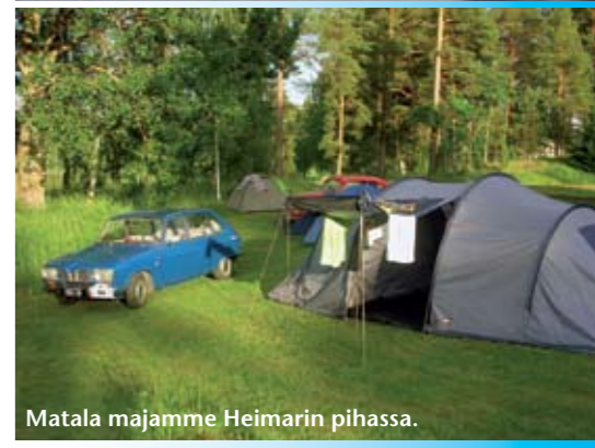
Matala majamme Heimarín pihassa.