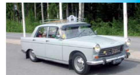
Kyllä ne ranskalaiset osaa.