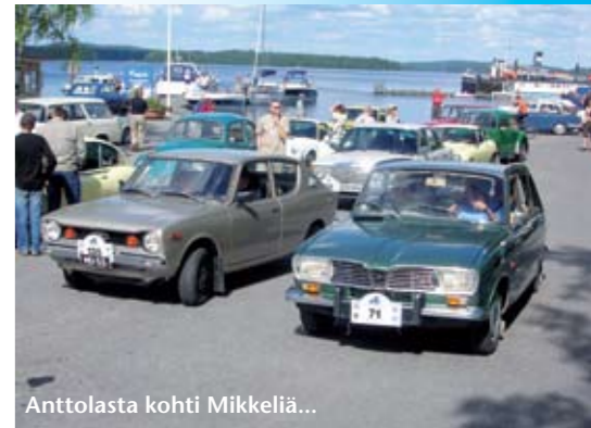
Anttolasta kohti Mikkeliä...