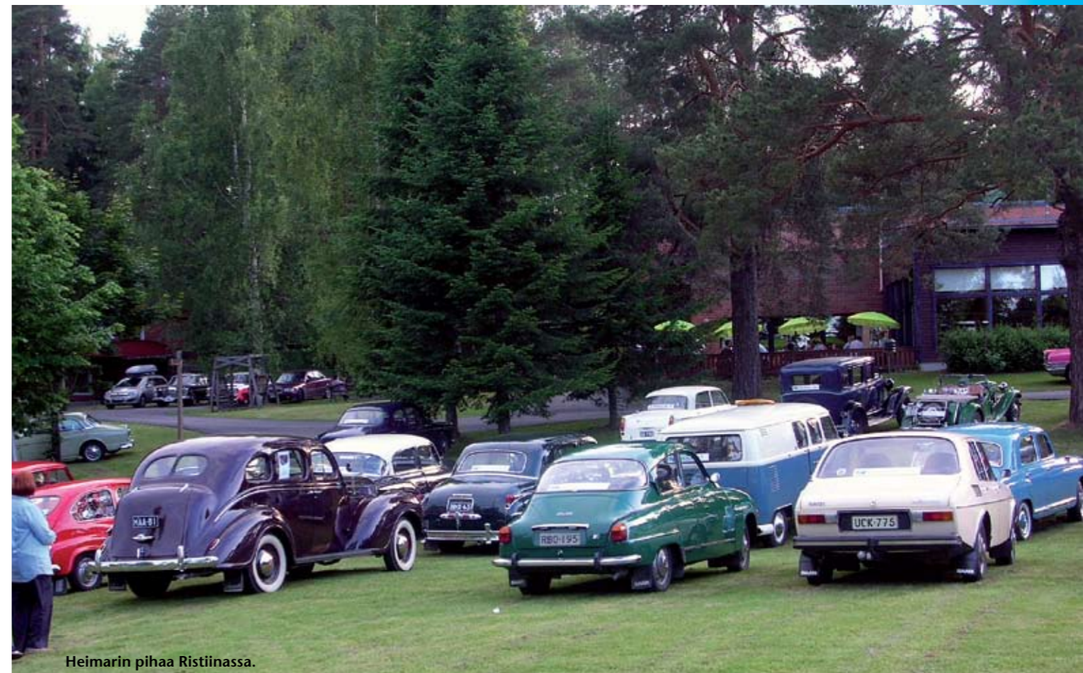
Heimarín pihaa Ristiinassa.