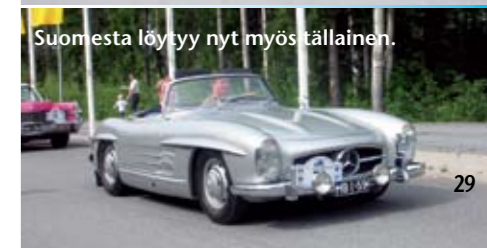
Suomesta löytyy nyt myös tällainen.